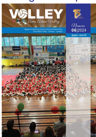
immagine di copertina